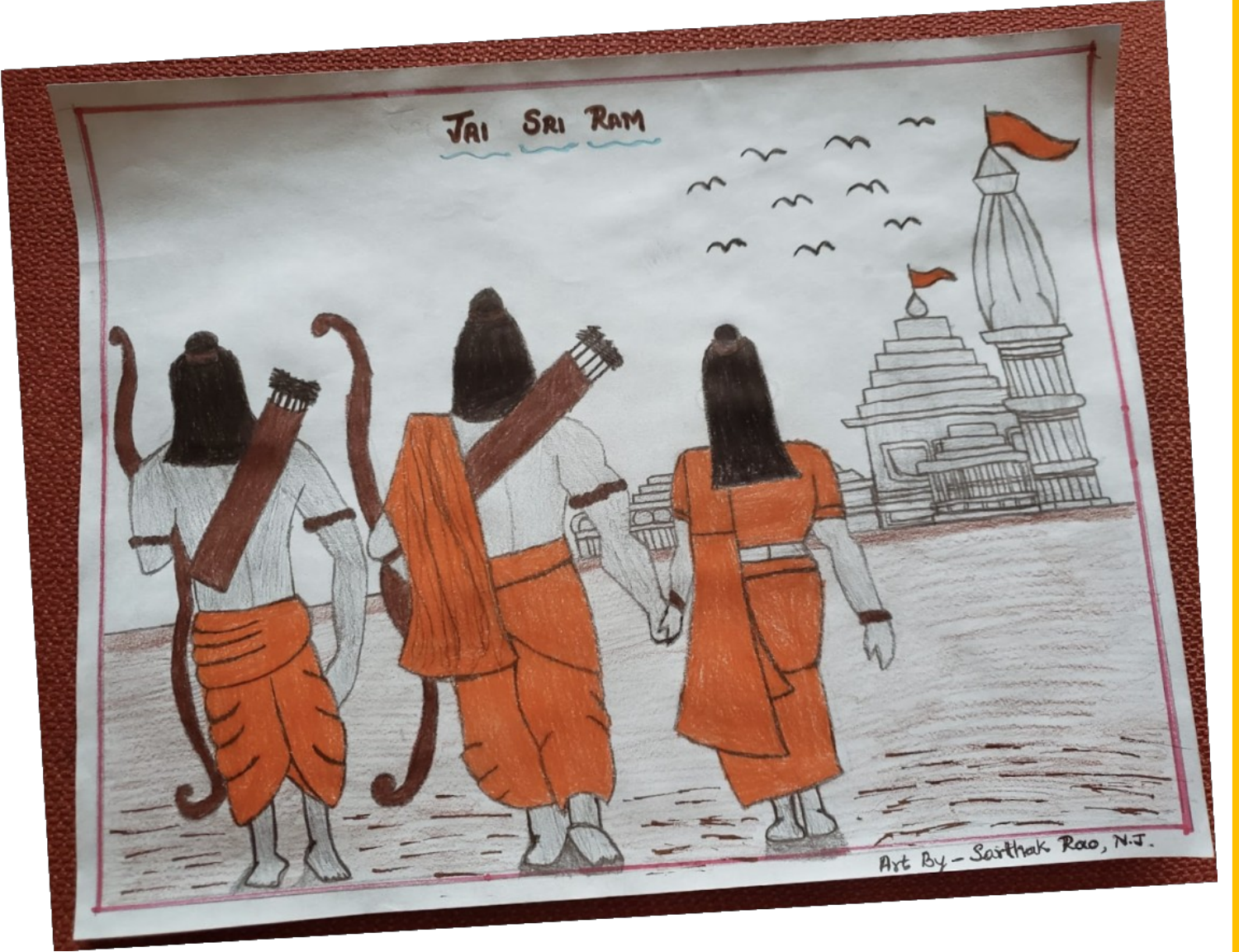
ಜೈ ಶ್ರೀ ರಾಮ್