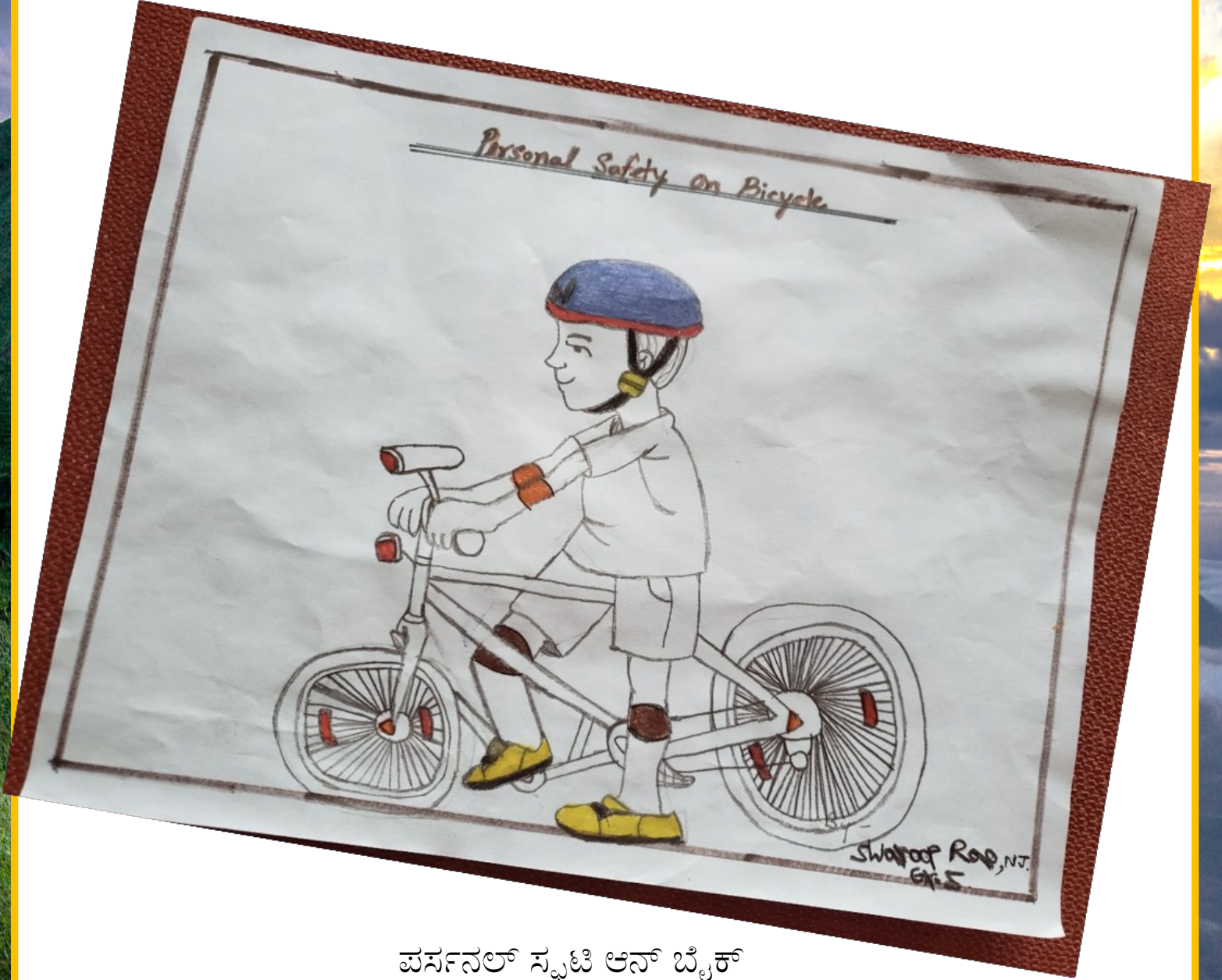
ಪರ್ಸನಲ್ ಸಫಟಿ ಆನ್ ಬೈಕ್