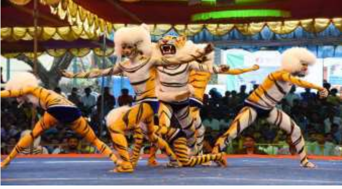
ನವರಾತ್ರಿ ಸಂದರ್ಭದಲ್ಲಿ ಹುಲಿ ವೇಷ