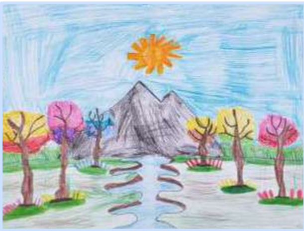
೪೦ ಚಿಣ್ಣರ ಚಿತ್ರಗಳು