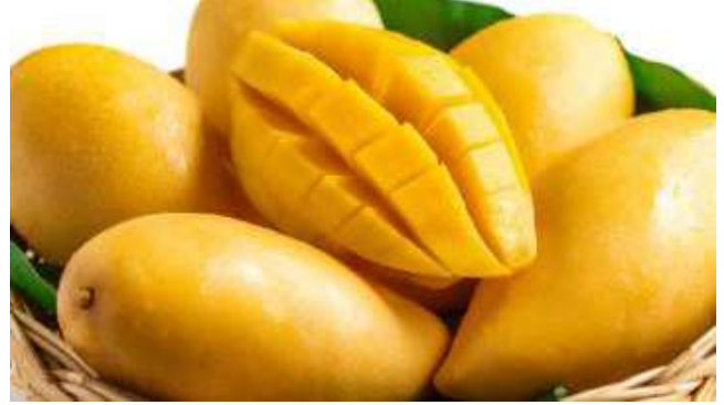
೩೪ ಮಾವಿನ ಸಿಹಿ ಅಡುಗೆಗಳು