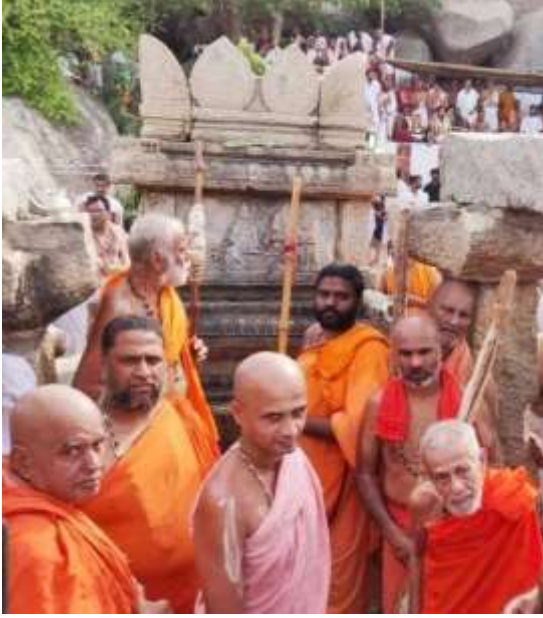
೩೨ ಶ್ರೀ ವ್ಯಾಸರಾಜರ ಬೃಂದಾವನ