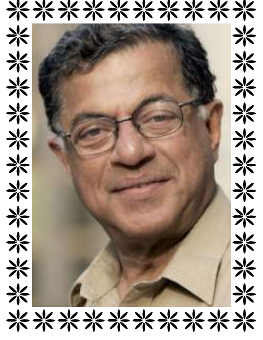
ಗಿರೀಶ್ ಕಾನಾಡ್ (ಮೇ ೧೯, ೧೯೩೮ - ಜೂನ್ ೧೦, ೨೦೧೯)