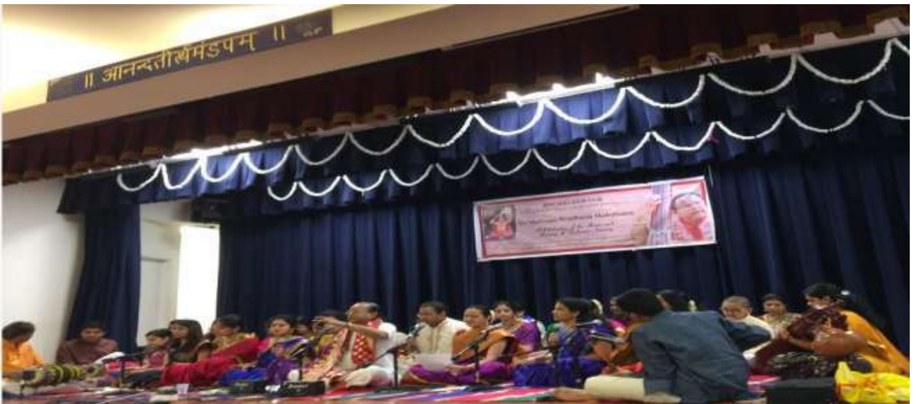
ಮಠದ ಸಮಾಜಮುಖಿ ಕಾರ್ಯಕ್ರಮಗಳು

ಭಾರತವು ಕಲೆ ಮತ್ತು ಸಂಸ್ಕೃತಿಗೆ ಹೆಸರಾದ ದೇಶ. ಅಲ್ಲಿ ಹುಟ್ಟಿ-ಬೆಳೆದು