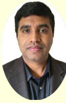
ಭಾಸ್ಕರ ತೈಲಗೇರಿ ಸಂಪಾದಕ ವರ್ಗ