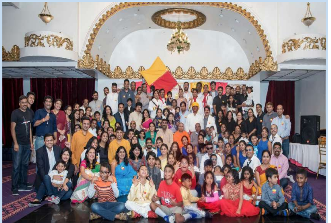
ಕಾರ್ಯಕ್ರಮದ ವೀಡಿಯೋ ಲಿಂಕ್

ಒಟ್ಟಿನಲ್ಲಿ ನಾವು ಎಲ್ಲಿದ್ದರೂ, ಹೇಗಿದ್ದರೂ ಕನ್ನಡವ ಮರೆಯೋಲ್ಲ, ಕನ್ನಡದ ಜೊತೆಗೆ ನಾವು, ನಮ್ಮ ಜೊತೆಗೆ ಕನ್ನಡ!