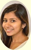
ಅಮೂಲ್ಯ ಕಟ್ಟೀಮನಿ ಸಂಪಾದಕ ವರ್ಗ